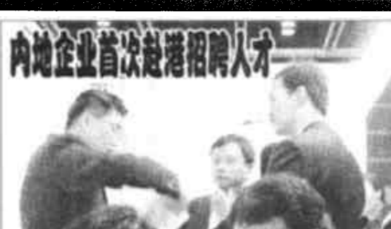
内地企业首次赴港招聘人才

湖南省的世界自然遗产张家界最近狠下决心进行景区楼堂馆所和居民房屋大拆迁。1998年联合国世界遗产委员会出示黄牌，限令张家界必须全部拆除景区内破坏性、污染性建筑，否则张家界就有可能被永远地摘去世界自然遗产这面金牌。